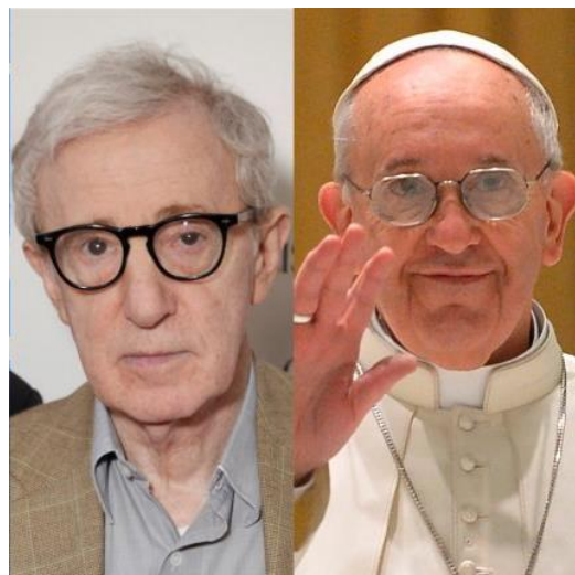
Woody Allen et le pape François