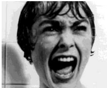
9. Marion Crane _____