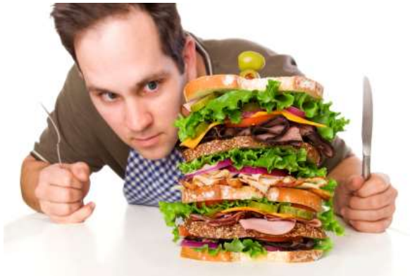
8. Cédric _____