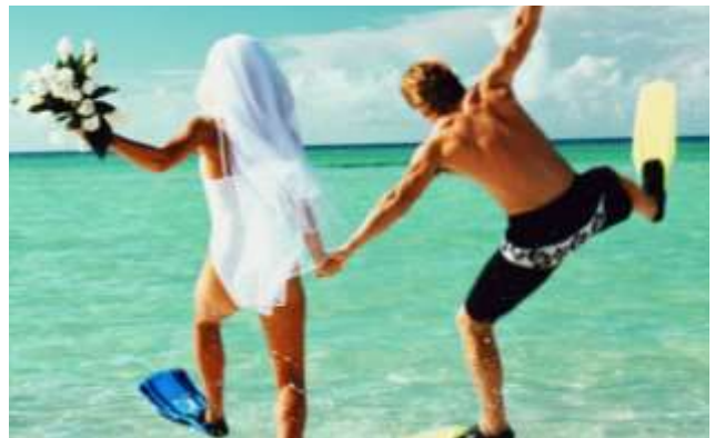
11. Les jeunes mariés _____ heureux.