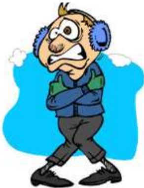
10. Ce Québécois _____